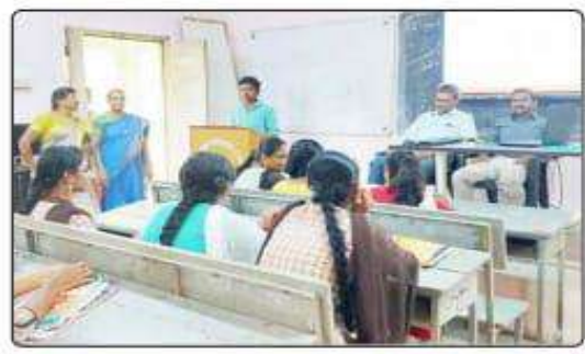
తిరువూడు. నవంబడు 16 (నేన) : విద్యాద్యల విషయపరిత్యానికి కొలచూనంగా వ్యాసరసన పోటీలు నిలుస్తామని ముంచుక చక్రలు పేర్కొన్నారు. అదేవిధంగా విద్యార్థుల వాగ్వాటికి చక్ర్మత్వ పోటీలు నిదర్శనంగా నిలుస్తాయని వారు పేర్కొన్నారు. నటన జాతీయ (గంథాలయ వారోత్సవాల సందర్భంగా తిరువూర (పథుత్వ రిగ్గీ కాటికిలో వ్యాసరసన, చక్రత్వ పోటీలు నిర్వహించారు. ఈ సందర్భంగా జరిగు కార్యక్రమానికి బ్రిటీరియన్ దాక్టర్ కె.కునుమ అధ్యక్రత పహించారు. న్యాయ నిర్ణీతలుగా వ్యవహరించిన తెలుగు పిథాగం జన్సార్లి విజయానందరాజు, కంఫ్యాటర్స్ సైన్స్ విథాగం జన్సార్లి జామ్ తామ్యూల్ వ్యవహరించారు. ఈ సందర్భంగా విద్యార్థులకు వ్యాసరసన చక్తుత్వ పోటీలు నిర్వహించారు. ఈ సందర్భంగా విద్యార్థులకు వ్యాసరసన చక్తుత్వ పోటీలు నిర్వహించారు. ఈ సందర్భంగా విద్యార్థులకు వ్యాసరసన చక్తుత్వ పోటీలు నిర్వహించారు. "పొలనా సంస్యకులి" గ్రామ సరిపాలయాల పాత్ర" అనే అంతం పైన వ్యాసదచన పోటీలు నిర్వహించారు. ఈ పోటీల్లో వివిధ విధాగాలకు వెందిన విద్యాద్యలు అనక్తిగా పార్కొన్నారు.(పథుత్వం తీసుకొచ్చిన పాలన సంస్యకులలో గ్రామ సరిపాలయాలు అమాథుమైన పార్ర పోటిస్తున్నాయని.

ద్రజలక చేతవగా పాలన అండతుందని వ్యాసరచనలో పలువురు విద్యార్థులు పేర్కొన్నారు. సామాన్య ద్రజలకు కావలసిన అన్ని రకాల ద్రభుత్వ పథకాల సమాచారం ,అన్ని వర్గాలకు కావలసిన వివిధ రకాల ద్రభుత్వ పథకాల సమాచారం ,అన్ని వర్గాలకు కావలసిన వివిధ రకాల ద్రభురికరం పురాండికీ శినుకాలో ఎవిష్టాండని విద్యార్థులు పేర్కొన్నారు. గ్రామ నచివాలయాల ద్వారా సమాజంలో ఉన్న అన్ని వర్గాల ద్రజలకు అందుతన్ని సేవలను వ్యాసరచనలో వారు వివరించారు. అదేవిధంగా పక్కళ్ళ పోలీల్లి "పుస్తక వరసంలో వచ్చిన అధునిక పోకదలపై చర్చించంది" అనే అండంపై పలుపుడు విద్యార్థులు పాల్గొని ద్రసంగంచారు. రిడిటల్ యుగంలో పుస్తక పఠశానికి కాలం తెల్లిందని భావిస్తున్న సమయంలో పుస్తకాల ద్రచరణ, పుస్తకాలు చదవడం అనేది ఏ మాత్రం కర్గలేదని పలుపురి విద్యార్థులు సంభాషించారు. అయితే పుస్తక పఠనం అనేది ట్రింటో విర్వహిల ద్రచరణ, పుస్తకాలు చదవడం అనేద ఏ మాత్రం కర్గలేదని పలుపురి విద్యార్థులు సంభాషించారు. అయితే పుస్తక పఠనం అనేది ట్రింటో విర్వహిల ద్రచరణ, విద్యార్థులు పేరిపోరించారు. అయితే పుస్తక పఠనం అనేది ట్రింటి విర్మహిలా విద్యంచారు విద్యార్థులు పార్చ న్నారు. ఏదో ఒక రూపంలో పుస్తకాలను చదవటా తెళ్లిందిని విద్యార్థులు పేర్చొ వలుతుం అధ్యావకులు, అధ్యాపోధిన పోరు విద్యాలనికు పార్చి వార్తు దలువరు అధ్యావకులు, అధ్యాపోరిన పారు విదరంగికు పార్గి పార్ర. దలుపరు అధ్యావకులు, అధ్యాపోరిన పారు విదరంగికు పార్గా పార్రగు